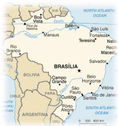
Don Giulio Luppi in Brasile dal 1969