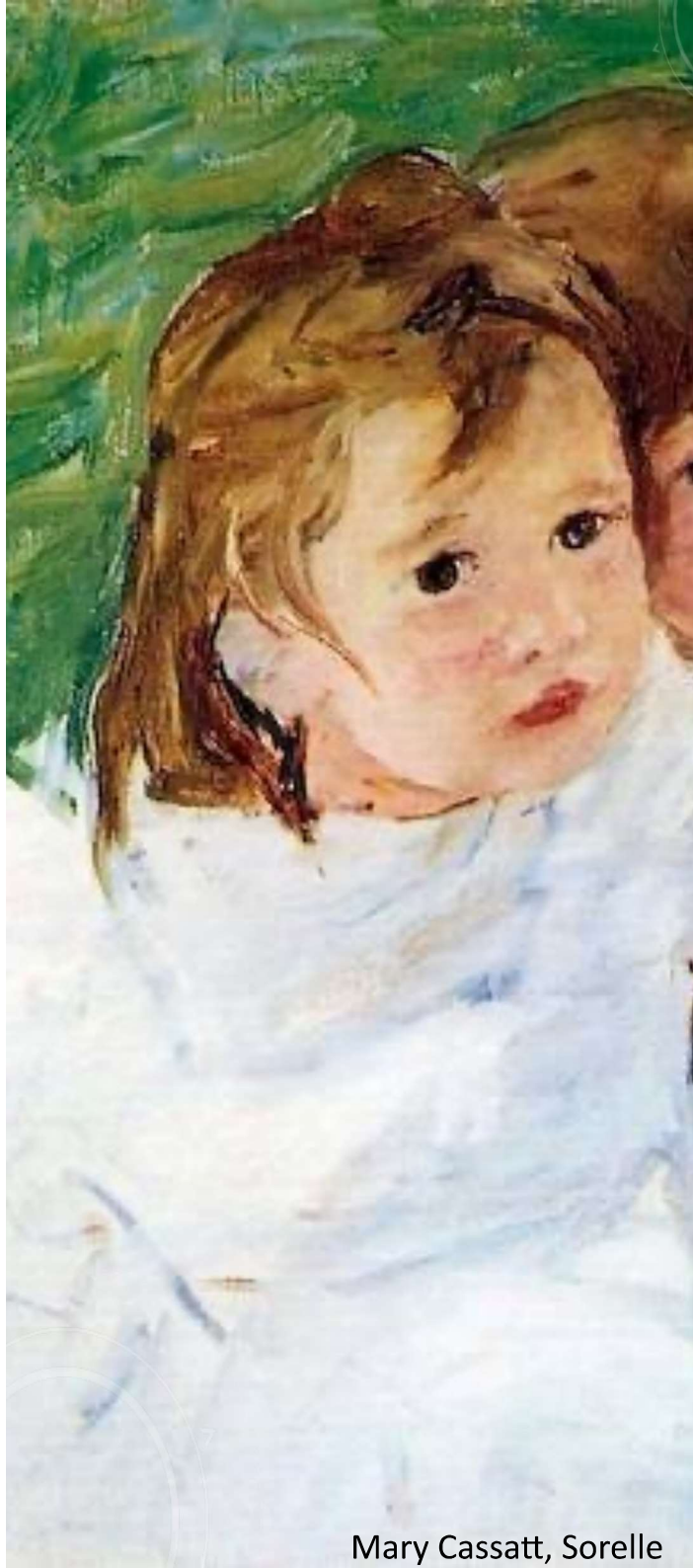
Mary Cassatt, Sorelle