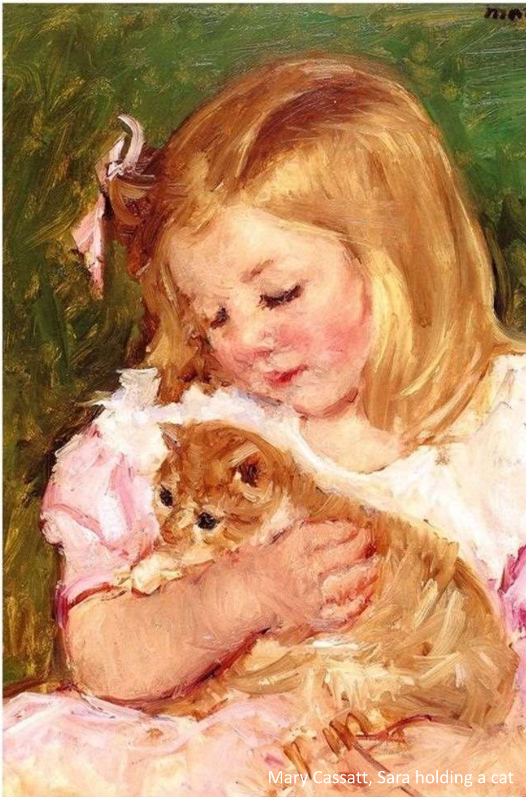
Mary Cassatt, Sara holding a cat

Platone definisce l'idea del bene “la massima scienza”