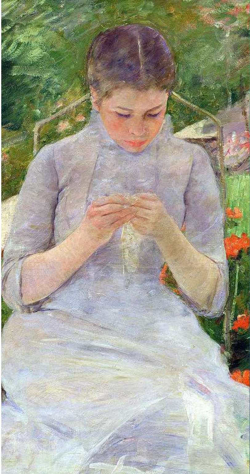
Mary Cassatt, Giovane donna cuce in giardino

Coltivare quel il modo dell'esserci che è secondo l'ordine proprio delle cose, cioè kata phusin (κατα φυσιν),