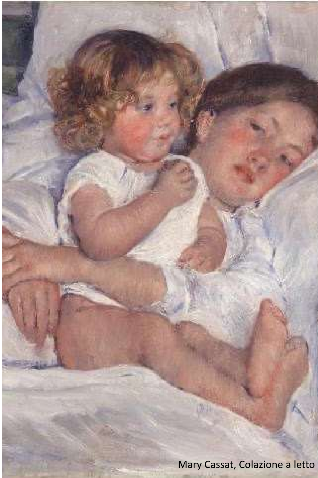
Mary Cassat, Colazione a letto

Nel Prometeo (Eschilo), Efesto, che comprende tutta la sofferenza di Prometeo costretto a patire sulla rupe sotto il calore del sole così gli dice: