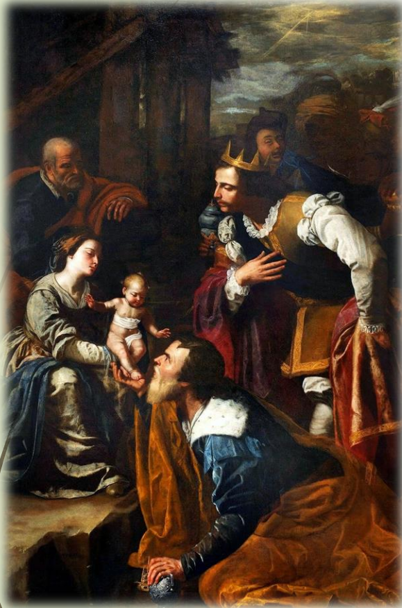
Artemisia Gentileschi, Adorazione dei Magi