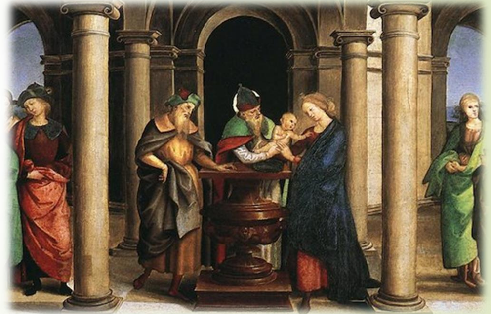
Raffaello, Presentazione al tempio , dettaglio della predella della Pala Oddi