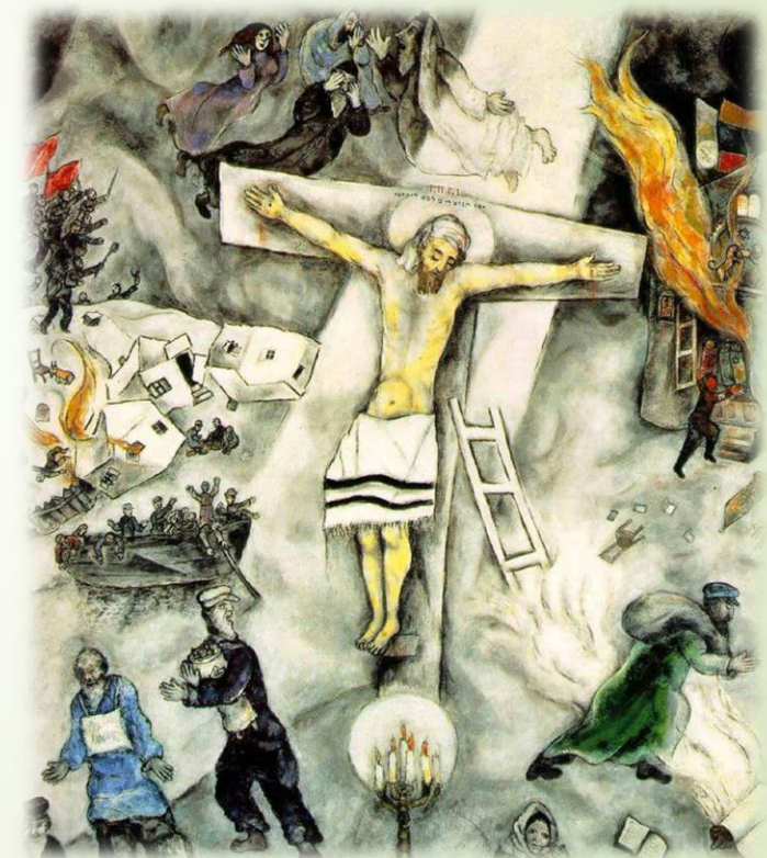
M. Chagall, Crocifissione bianca

«Nel volto di Gesù c'è la verità dell'uomo» (papa Francesco)