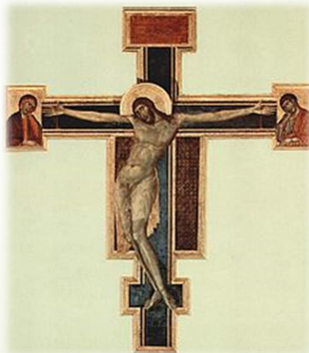
Cimabue, Crocifisso di Santa Croce