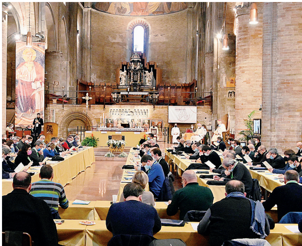
La quarta Sessione del XIV Sinodo ospitata in cattedrale; oggi i lavori di gruppo si sposteranno al Collegio vescovile

si sposteranno presso il Collegio vescovile per i lavori. Tre sono i passi che dovranno essere compiuti. Nella prima parte della mattinata tre gruppi saranno impegnati sul capitolo terzo "Terra", mentre gli altri tre affronteranno il quarto capitolo "Persone". Il secondo passo che occuperà l'ultima ora di lavoro della mattinata, permetterà ai gruppi di concentrarsi su alcuni aspetti che si mostreranno particolarmente bisognosi di integrazione o di riformulazione. Qui giocherà molto l'abilità dei coordinatori, che in