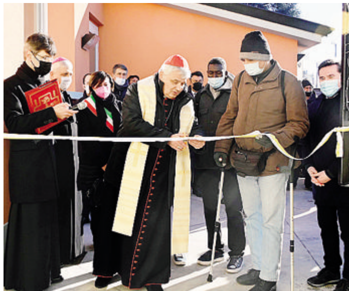
Il taglio del nastro del nuovo dormitorio all'ex convegno San Giuseppe