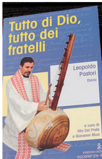
La copertina del "Diario"

getto K703 che riguarda il Centro di formazione per catechisti nel villaggio di N'Loren /Mansoa, diocesi di Bissau, fondato negli anni '90 proprio dai missionari del Pime. Il progetto vorrebbe formare "famiglie catechiste" ed educare coppie che siano testimoni di vita cristiana nei villaggi; ristrutturare due padiglioni; creare piccoli alloggi per ospitare fino a dieci famiglie; costruire un padiglione con una cappella e due sale polivalenti per formazione e incontri. Come donare? Le modalità sul sito www.pimemilano.com sezione Progetti/adozioni. ■