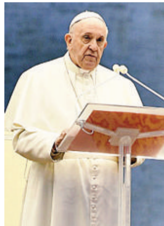
Papa Francesco invita alla preghiera

Giovedì 14 maggio sarà la Giornata interreligiosa di preghiera, digiuno e invocazione per l'umanità proposta dall'Alto Comitato per la Fratellanza umana. Preghiera, digiuno e opere di carità che sono valori universali. La Giornata non vuole sminuire il ruolo della medicina e della ricerca scientifica in questo momento, quanto piuttosto invitare ciascuno ad accompagnare il tempo di pandemia con atteggiamento di fiducia in Dio e a ritrovare la consapevolezza che universali sono anche la condizione umana e la vita sul nostro pianeta. «Stiamo invitando tutti, leader delle Chiese cristiane, responsabili delle altre religioni, istituzioni e organizzazioni internazionali; operatori ed esponenti del mondo civile, politico e religioso; rappresentanti del mondo dell'arte e della scienza; credenti e non credenti, persone di buona volontà, affinché aderiscano a questa giornata di preghiera per l'umanità. Ci siamo sentiti piccoli di fronte a un nemico sconosciuto e invisibile che ci ha messo davanti ad una sfida che ora solo insieme dobbiamo superare»: così il cardinale