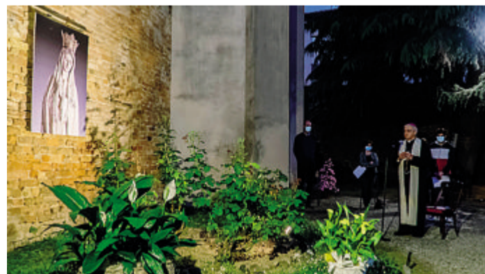
Il Rosario recitato dal vescovo e animato dalla parrocchia della cattedrale

rantire la migliore preparazione alla vita proprio alle giovani generazioni per un futuro luminoso per tutti». Dopo aver pregato per tutti gli studenti, dall'infanzia all'Università, con un pensiero particolare e un incoraggiamento agli studenti della maturità, e un ricordo ai dirigenti scolastici, al personale docente e non docente, alle famiglie e alle associazioni, il vescovo ha ricordato per il prossimo anno agli studenti delle superiori la sua disponibilità per una visita alla casa episcopale: «Rinnovo poi l'invito a studiare - ha concluso -, perché abbiamo bisogno