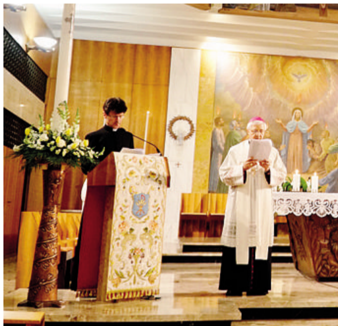
La Veglia di preghiera in Seminario per le vocazioni

Il prossimo mercoledì, il vescovo sarà al santuario della Madonna della Costa, alle ore 20.45, per recitare il Rosario, unendo l'intenzione di preghiera ecumenica e interreligiosa. Venerdì, invece, la preghiera del Rosario sarà dedicata al mondo del lavoro, e si svolgerà a porte chiuse nell'area industriale di San Fereolo, sempre alle 20.45. ■