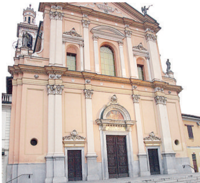
La Messa sarà a porte chiuse ma si potrà seguire online e sul canale 111