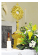
Preghiera e adorazione alla chiesa della Pace

■ La Pro Sacerdotio prosegue con i consueti incontri mensili caratterizzati dalla preghiera e dall'adorazione eucaristica. Il nuovo appuntamento è in programma nella giornata di domani, domenica 7 marzo, a partire dalle ore 16 alla chiesa della Pace, il piccolo santuario che sorge in corso Umberto, nel centro di Lodi. L'incontro proporrà dunque la recita del Santo Rosario, dei Vespri e l'adorazione eucaristica. Si tratta di un'occasione davvero preziosa per tutti coloro che hanno a cuore il futuro della Chiesa. ■