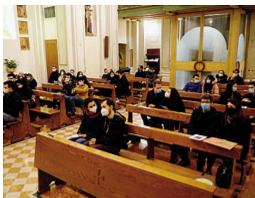
Sopra le coppie di fidanzati, in alto il vescovo (Gaudenzi)