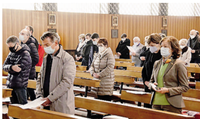
Nelle immagini l'incontro di sabato scorso in Seminario fra il vescovo Maurizio e i Rappresentanti parrocchiali, giovani e adulti della diocesi; a lato, monsignor Malvestiti con il vicario generale don Bassiano Uggè