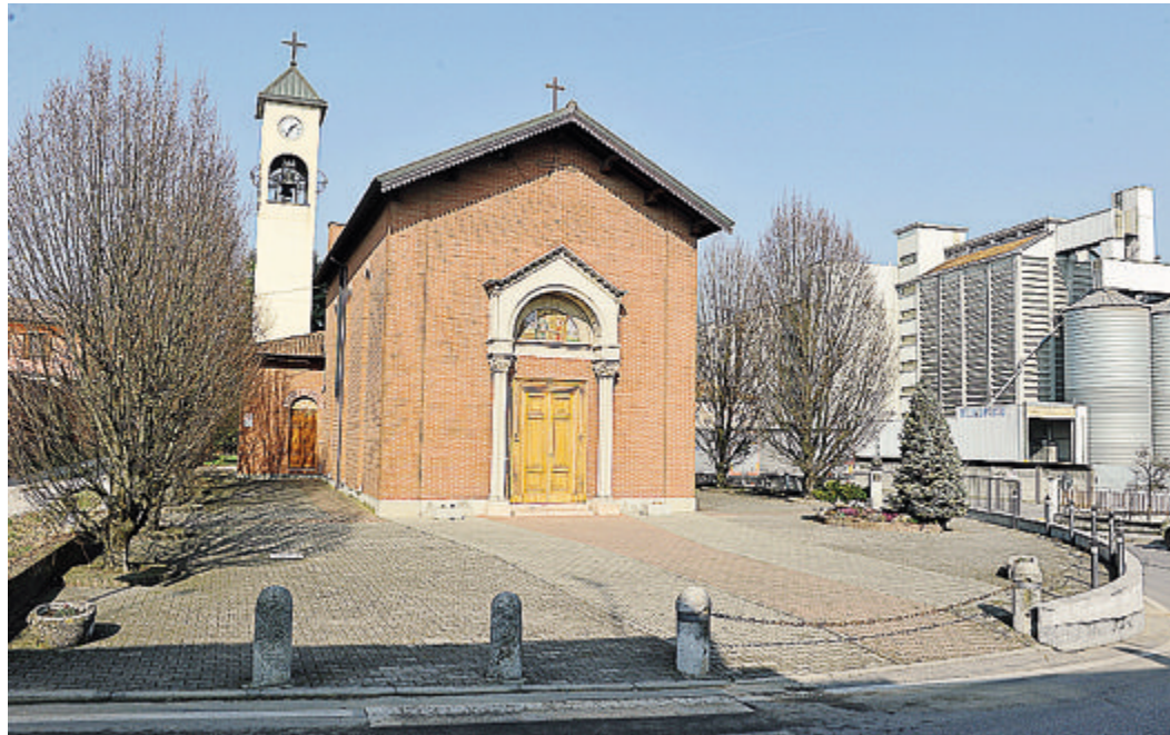
Casoni di Borghetto è l'unica parrocchia nella diocesi di Lodi dedicata a San Giuseppe: la chiesa fu eretta nel 1922

L'unica parrocchia a lui intitolata è quella di Casoni di Borghetto