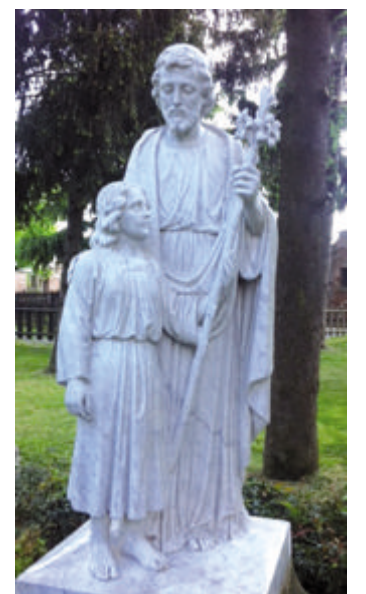
A sinistra l'oratorio dei Santi Giuseppe e Ambrogio alla Cascina Fraccina in Spino d'Adda, sopra la statua di San Giuseppe che si trova nel Parco dei presepi di Ossago