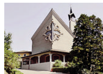
A lato il Lazzaretto di Sant'Angelo e in basso da sinistra la chiesa della Persia e una formella dedicata a San Giuseppe conservata nella stessa; sopra il Carmelo di Lodi