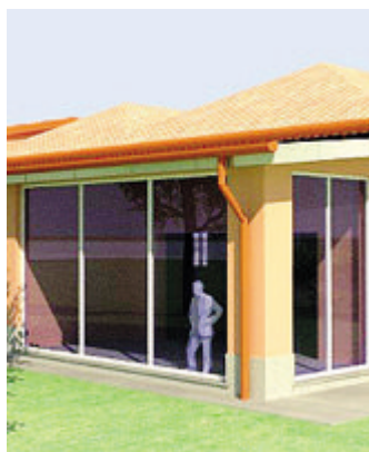
Il progetto della Casa San Giuseppe

possano lasciare il segno, fare la differenza nella vita di chi non ha nulla. Attraverso i "Regali solidali", infatti, Caritas offre una possibilità per tutte le tasche: a partire dalla cifra simbolica di 10 euro sarà possibile contribuire con l'acquisto di un mattone che, uno dopo l'altro, doneranno un nuovo volto alla struttura d'accoglienza; e poi sedie (25 euro), coperte (30 euro), tavoli (50 euro), letti (100 euro) e armadi (150 euro). "Fare del bene fa bene", per cui grazie alla generosità dei Lodigiani, sarà possibile portare a completamento i lavori di riqualificazione, inaugurando il dormitorio in settembre per «un importante segno di carità e di vicinanza agli ultimi della diocesi». Per cui occorrerà raggiungere un numero di 29 posti letto con altrettanti armadi, 10 tavoli, 58 tra coper-