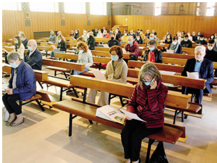
Il confronto che si è tenuto nello scorso ottobre sempre in Seminario

Questa mattina, i Rappresentanti delle parrocchie si incontrano in Seminario, per l'incontro di formazione e confronto di metà anno a livello diocesano. Il precedente convegno è dello scorso ottobre, quando il vescovo aveva espresso parole di sincera gratitudine ai partecipanti per l'impegno dimostrato durante l'anno, evidenziando i temi delle vocazioni, dell'educazione, e della dimensione missionaria della Chiesa. L'appuntamento è fissato in Seminario alle ore 9.15: la mattinata sarà aperta dalla recita della preghiera delle Lodi, presieduta dal vescovo Maurizio. Seguirà una riflessione biblica affidata a don Davide Scalmanini, l'animatore presbitero dei Rp e Rpg che vuole diventare il "seminario laico" di cui ha più volte parlato il vescovo Maurizio, indicando questo organismo come una via di incremento della sinodalità ordinaria nella Chiesa lodense, an-