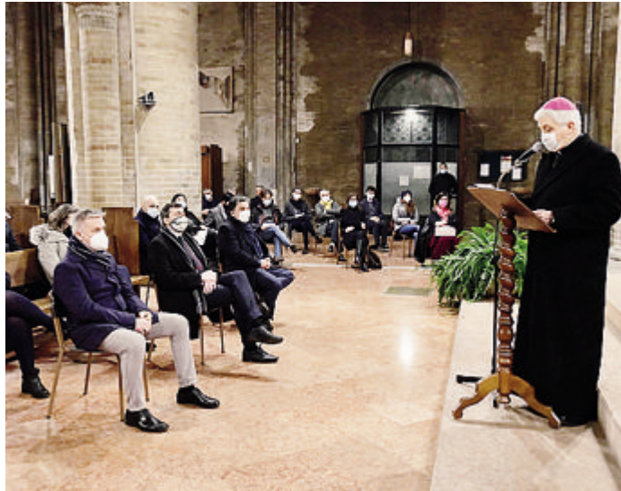
L'intervento del vescovo Maurizio ai Colloqui di San Bassiano in cattedrale

mentare, economica e migratoria, e provocando pesanti sofferenze e disagi. Penso anzitutto a coloro che hanno perso un familiare o una persona cara, ma anche a quanti sono rimasti senza lavoro. Un ricordo speciale va ai medici, agli infermieri, ai farmacisti, ai ricercatori, ai volontari, ai cappellani e al personale di ospedali e centri sanitari, che si sono prodigati e continuano a farlo, con grandi fatiche e sacrifici, al punto che alcuni di loro sono morti nel tentativo di essere accanto ai malati, di alleviarne le sofferenze o salvarne la vita».