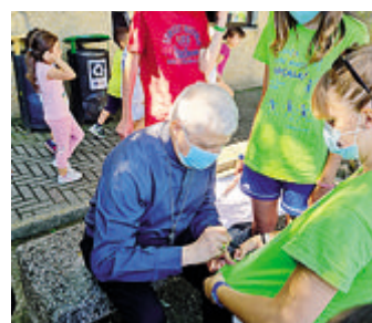
Monsignor Malvestiti ha incontrato all'oratorio di Zelo i bambini del Grest e del centro estivo della materna Maria Immacolata Cuti

simo come noi stessi. E se qualcuno mi tratta male, lo devo amare? Certo starò attento a difendermi, ma l'amore di Gesù è universale. Lo Spirito Santo è l'amore di Dio riversato nei nostri cuori». E tutti possono fare la loro parte nella comunità, affinché la nostra «vita sia un canto d'amore». La Chiesa di Lodi, insieme sulla via, tra memoria e futuro, ha annunciato il suo XIV Sinodo e «ognuno di noi deve essere una pagina vivente nel libro del sinodo». L'applauso finale ha concluso la bella giornata insieme per il Grest di Zelo che quest'anno ha avuto 120 partecipanti e 25 animatori, altri 60 hanno partecipato al centro estivo alla scuola materna ■