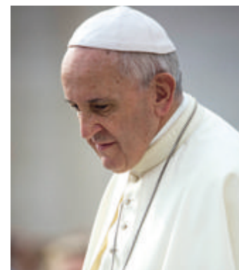
Il Santo Padre invita alla preghiera

Le parole di Papa Francesco, pronunciate domenica 13 e 20 giugno durante la preghiera dell'Angelus, scuotono le coscienze e chiedono di guardare con lucidità alle tragedie che continuano a verificarsi nel Mare Nostrum . «Il Mediterraneo - ha detto il Papa il 13 giugno - è diventato il cimitero più grande dell'Europa». Aggiungendo nella domenica successiva: «Apriamo il nostro cuore ai rifugiati; facciamo nostre le loro tristezze e le loro gioie; impariamo dalla loro coraggiosa resilienza!». Secondo l'Organizzazione mondiale per le migrazioni (Oim), nei primi cinque mesi dell'anno sono morte nel Mediterraneo centrale 632 persone (+200% rispetto allo scorso anno), di cui 173 accertate e 459 disperse. Sono più di 4 al giorno, a cui purtroppo occorre aggiungere le vittime di altre rotte del mare, tra cui quella delle Canarie che ha avuto una tremenda escalation nell'ultimo anno, e i tanti fratelli e sorelle morti lungo il deserto del Sahara, in Libia o nei Balcani. Di fronte a questo dramma, su impulso della Presidenza della Cei, viene rivolto un invito alle comunità ecclesiali: non dimenticare quanti hanno perso la loro vita mentre cercavano di raggiungere le coste italiane ed europee. La proposta è quella di leggere in tutte le parrocchie la seguente preghiera dei fedeli, domenica 11 luglio, in occasione della festa di San Benedetto, patrono d'Europa: