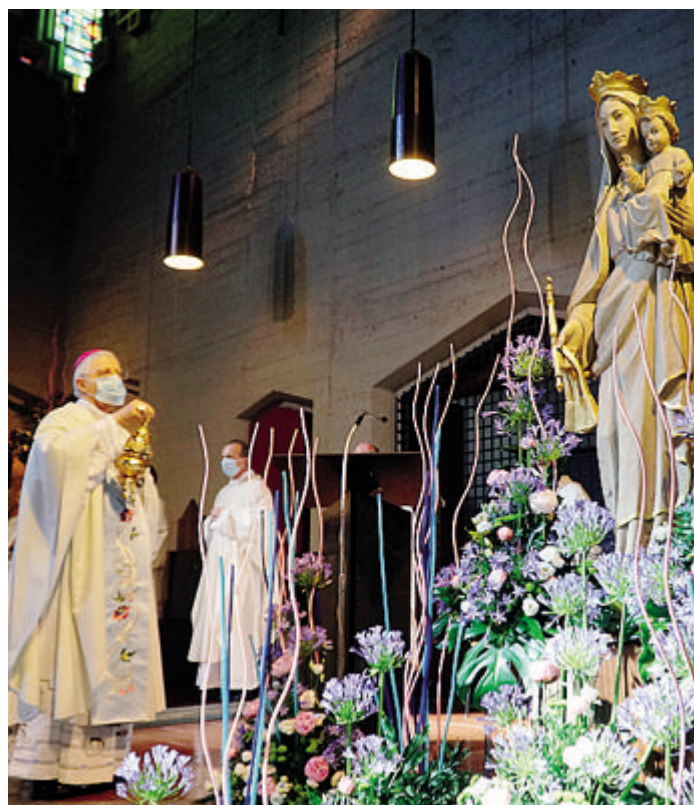
La Messa dell'anno scorso nella solennità della Beata Vergine del Carmelo