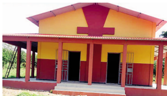
Il Centro di formazione per catechisti di N'Loren/Mansoa in Guinea Bissau

nese, in Brianza e non solo. Padre Leopoldo era nato a Lodi città nel 1939. Già missionario in Guinea Bissau dal 1974 al 1978, cominciò a scrivere il diario spirituale il 29 giugno 1983 a Monza, dove era direttore spirituale nel seminario teologico del Pime. Nel Pontificio istituto missioni esteri, padre Leopoldo era entrato dopo l'infanzia e la primissima giovinezza vissute a Lodi. Per la Guinea Bissau, ex colonia portoghese, aveva maturato la decisione di ripartire pur sapendo che avrebbe potuto comportare rischi per la sua salute. Così è stato. Tornato a Linate