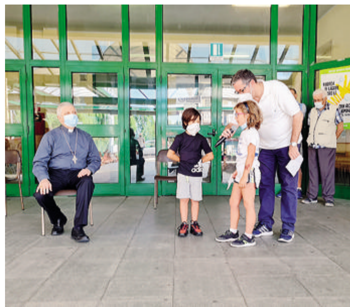
Una conclusione speciale per il centro estivo con la presenza del vescovo

Monsignor Malvestiti ha regalato un sorriso a tutti, ha coinvolto i più piccoli e i più grandi e ha lasciato la parola a Vincenzo, uno dei ragazzi che frequentano l'oratorio, che ha scritto un piccolo discorso per ringraziare tutti coloro che gli sono stati vicini e per urlare il suo personale “evviva” al vescovo. D'altronde il Grest di Paullo ha saputo costruire percorsi inclusivi e