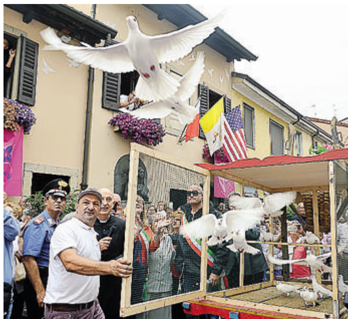
Quest'anno non mancherà l'appuntamento con il volo delle colombe