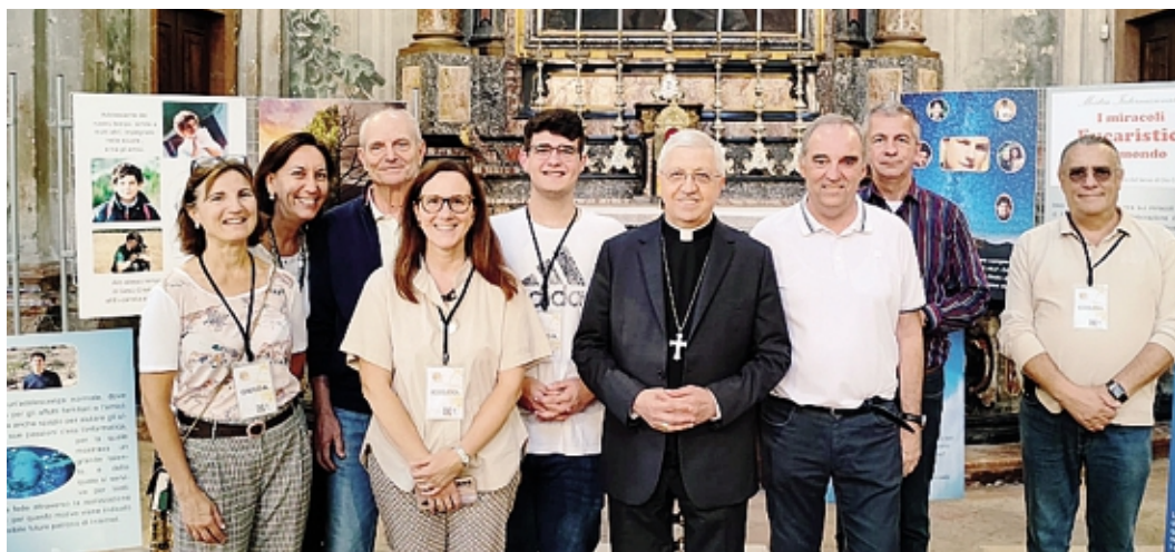
Il vescovo Maurizio alla mostra sui Miracoli eucaristici con i volontari, sotto il cardinale Angelo Bagnasco

La settimana del VII Congresso eucaristico diocesano prosegue con la presenza del cardinale Angelo Bagnasco che oggi, con inizio alle ore 9.45 in Cattedrale, predicherà nella mattinata di spiritualità per il clero, religiose e religiosi. Il cardinale Bagnasco, già presidente della Conferenza episcopale italiana, inviato speciale di Papa Francesco al Congresso eucaristico di Genova nel 2016, relatore al Congresso eucaristico internazionale di Budapest nel 2021, nel 2017 ha presieduto il solenne pontificale nella Cattedrale di Lodi in occasione della festa di San Bassiano. Nel pomeriggio, il cardinale Bagnasco,