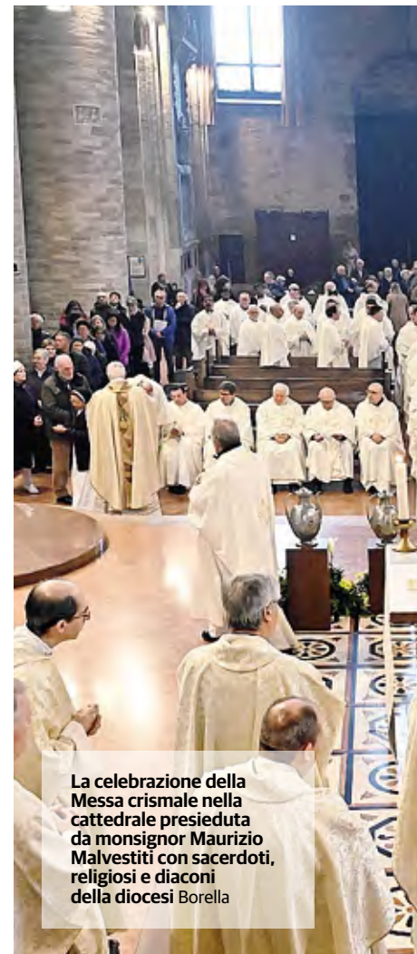
La celebrazione della Messa crismale nella cattedrale presieduta da monsignor Maurizio Malvestiti con sacerdoti, religiosi e diaconi della diocesi Borella

Continueremo a dialogare con la Chiesa italiana e universale per dare concretezza alla forma sinodale