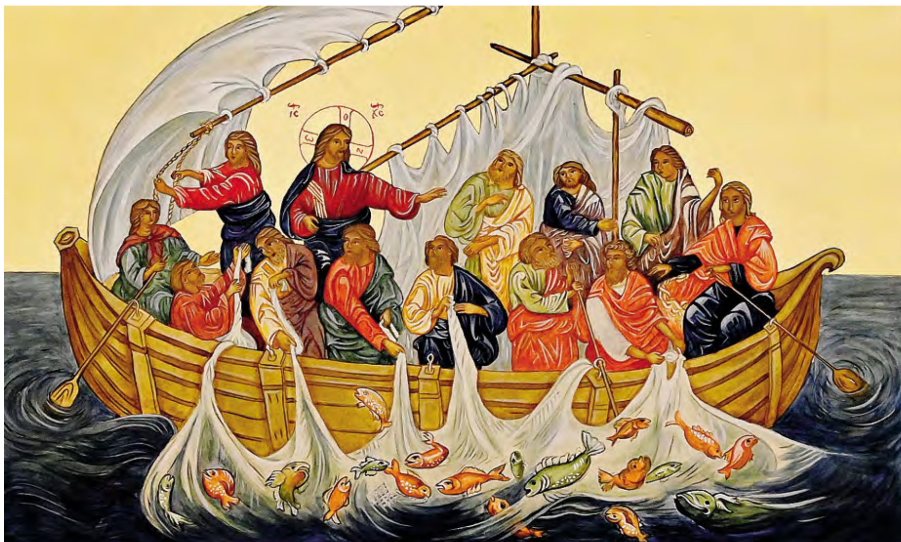
Un particolare della pesca miracolosa, icona scritta da Alberta Bozzi di Lodi, custodita nel palazzo vescovile di Lodi, fotografata da Pasqualino Borella per la copertina della Pasqua 2025