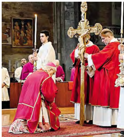
La liturgia della Passione, presente una rappresentanza dell'Ordine del Santo Sepolcro di Gerusalemme Borella