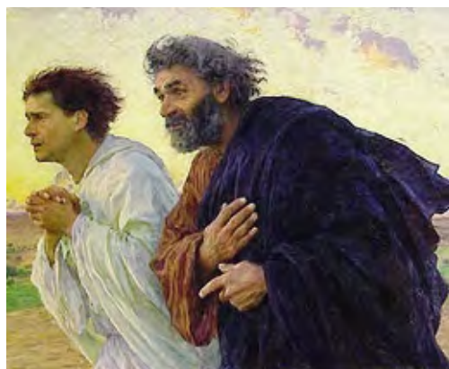
Pietro e Giovanni corrono al sepolcro Eugène Burnand

Corrono per verificare la notizia che li ha toccati sul vivo a motivo del profondo affetto che nutrivano per Gesù. Ma non corrono per fede, non ancora almeno.