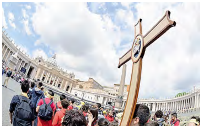
In alto il vescovo monsignor Maurizio Malvestiti e il Beato Carlo Acutis, che verrà canonizzato durante il Giubileo degli adolescenti

scovo Maurizio, in un appuntamento voluto proprio dal vescovo. Il programma ufficiale del Giubileo prevede la preghiera iniziale della "Via Lucis", venerdì 25 aprile all'Eur; gli incontri dei "Dialoghi con la città" il 26 aprile; e proprio sabato 26, dalle 17 alle 19, anche i nostri ragazzi parteciperanno al grande concerto al Circo Massimo, una bella festa musicale con tanti artisti tra cui anche i "The Kolors" (quelli di "Frida - mai, mai, mai"), "Italodisco", "Un ragazzo, una ragazza"). Domenica 27 aprile il Giu-