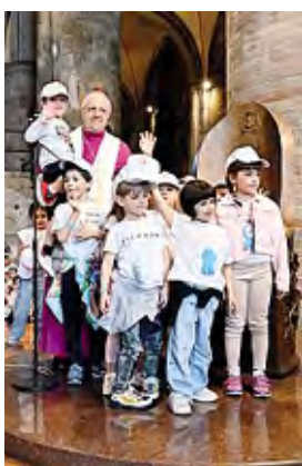
Il Giubileo delle Scuole dell'infanzia ieri in cattedrale a Lodi Borella

«Soldati di pace», in grado di portare la luce della gioia, della speranza e della gratitudine nel mondo intero: i bambini e le bambine delle scuole dell'infanzia paritarie delle parrocchie e degli istituti religiosi del territorio ieri pomeriggio hanno incontrato il vescovo di Lodi monsignor Maurizio Malvestiti in cattedrale: «La casa di tutti i lodigiani - ha detto il vescovo - accogliendo un migliaio di piccini -: un popolo in cammino, che sta compiendo i primi passi nella vita». Ad accoglierlo monsignor Franco Badaracco, che a nome dei parroci e dei dirigenti ha espresso gratitudine alla diocesi e alle parrocchie che credono al progetto educativo delle scuole cattoliche. I bambini sono segni di speranza verso il futuro del mondo che, nell'Anno giubilare, mantengono viva la gioia per la nascita di Gesù. «Gratitudine e gioia chiamano la speranza, che