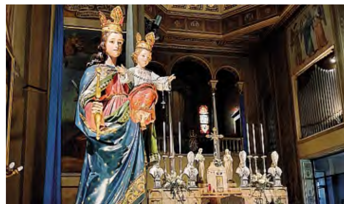
La statua di Santa Maria Ausiliatrice, sotto la chiesa parrocchiale