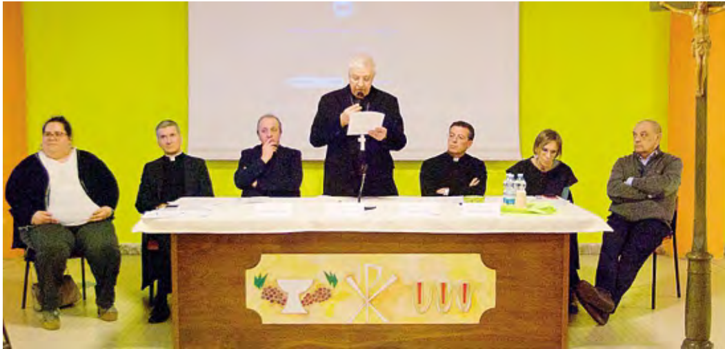
All'oratorio San Luigi l'Assemblea del vicariato di Codogno guidata da monsignor Maurizio Malvestiti Ronsivalle