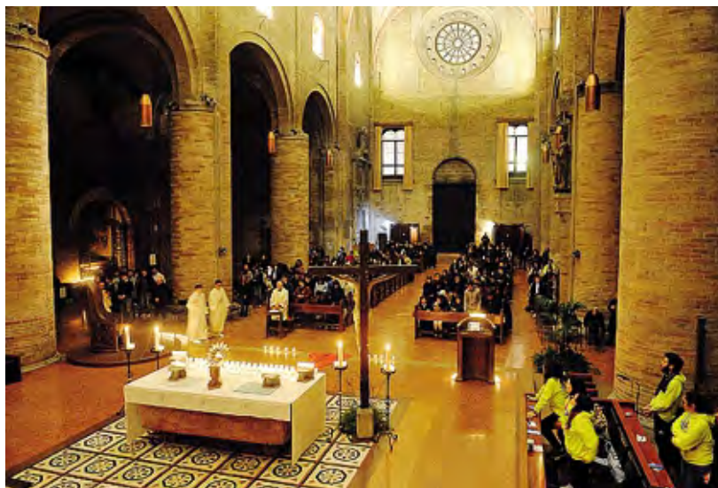
L'adorazione eucaristica dello scorso anno con i giovani nella Cattedrale di Lodi

La preghiera permette di sentire e respirare la presenza del Signore. Quella silenziosa e personale davanti all'Eucaristia consente di interiorizzare la Parola, contemplare l'amore del Signore, fare discernimento sulle scelte importanti della vita. «Adorare significa imparare a stare con Lui, a fermarci a dialogare con Lui, sentendo che la sua presenza è la più vera, la più buona, la più importante di tutte. Adorare il Signore vuol dire dare a Lui il posto che deve avere; adorare il Signore vuol dire affermare, credere, non però semplicemente a parole, che Lui solo guida veramente la nostra vita; adorare il Signore vuol dire che siamo convinti davanti a Lui che è il solo Dio, il Dio della nostra vita, il Dio della nostra storia»: così Papa Francesco qualche anno fa a proposito dell'adorazione eucaristica, che per domani sera viene proposta dall'Ufficio per la pastorale giovanile e gli oratori della diocesi e dall'Azione cattolica diocesana in Cattedrale a Lodi, e sarà guidata dal vescovo Maurizio. Con inizio previsto alle ore 19, sono attesi i giovani a questo appuntamento di preghiera. Dalle 19.15 ci saranno un tempo