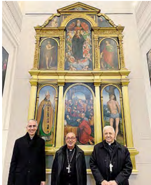
A sinistra il cardinale De Donatis con il vescovo Maurizio e don Fonte a San Cristoforo, a destra l'incontro in cripta; sotto con i seminaristi

Il cardinale Angelo De Donatis a Lodi. Il penitenziere maggiore della Penitenzieria apostolica mercoledì scorso è stato accolto dal vescovo di Lodi monsignor Maurizio Malvestiti e dai Canonici nella cripta della Cattedrale. In Episcopio il prelado ha avuto modo di confrontarsi con gli alunni del Seminario vescovile e i loro educatori. Giovedì mattina il cardinale De Donatis ha presieduto la Messa al Carmelo San Giuseppe, concelebrata dal vescovo Maurizio, quindi ha guidato l'incontro di formazione del clero al Collegio Scaglioni. Non è mancata la visita alla seconda sede del Museo diocesano di arte sacra, accompagnato da monsignor Malvestiti e dal direttore don Flaminio Fonte, che ha illustrato al prelado i tesori conservati nella chiesa di San Cristoforo. ■