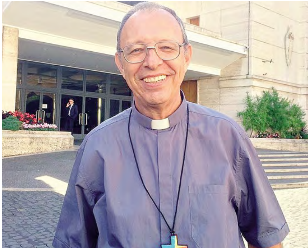
Monsignor Flavio Giovenale, vescovo della diocesi di Cruzeiro do Sul, località del Brasile nello Stato dell'Acre

«Si tratta di classi elementari e medie, rispetto alle quali c'è un'importante collaborazione con lo Stato. Infatti, queste scuole sono state istituite dalla Chiesa, e successivamente sono passate allo Stato: la più antica ha 78 anni ed è intitolata a san Giuseppe. Due anni fa, però, lo Stato ci ha chiesto di tornare ad assumerne noi la direzione, a fronte di una sovvenzione che ci concede: per il governo è un risparmio sui costi, e noi offriamo volentieri il nostro supporto di formazione e di impronta cristiana.»