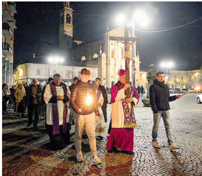
La Statio vicariale a Casale dell'anno scorso guidata dal vescovo Maurizio

Il 13 marzo la presidenza della Conferenza episcopale italiana promuove una giornata di preghiera e digiuno per la pace. «L'escalation di violenza in Medio Oriente rischia di trascinare l'umanità in una guerra di proporzioni planetarie, una nuova inutile strage dalle conseguenze incalcolabili» ha scritto il cardinale Matteo Zuppi, presidente della Cei, in una Lettera rivolta ai vescovi italiani e alle comunità ecclesiali. Unendo la propria voce a quella del Santo Padre che ha chiesto di «fermare la spirale della violenza prima che diventi una voragine irreparabile», la Giornata di preghiera e digiuno, vuole essere un invito rivolto a tutte le comunità ecclesiali affinché chiedano «al Re della Pace di salvare l'umanità dagli orrori e dalle lacrime di tutti i conflitti in corso». «Allo stesso tempo intendiamo ribadire, ancora una volta, che la guerra non è e non può mai essere la risposta; che la logica della forza non può sostituirsi alla paziente arte della diplomazia; che il rumore assordante delle armi non può soffocare la dignità e le aspirazioni dei popoli; che la pau-