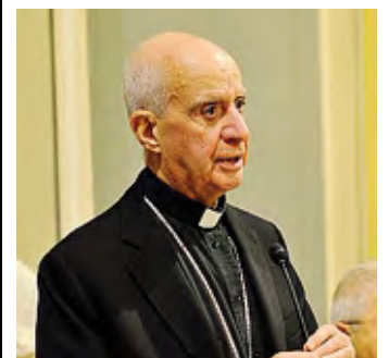
Monsignor Rino Fisichella