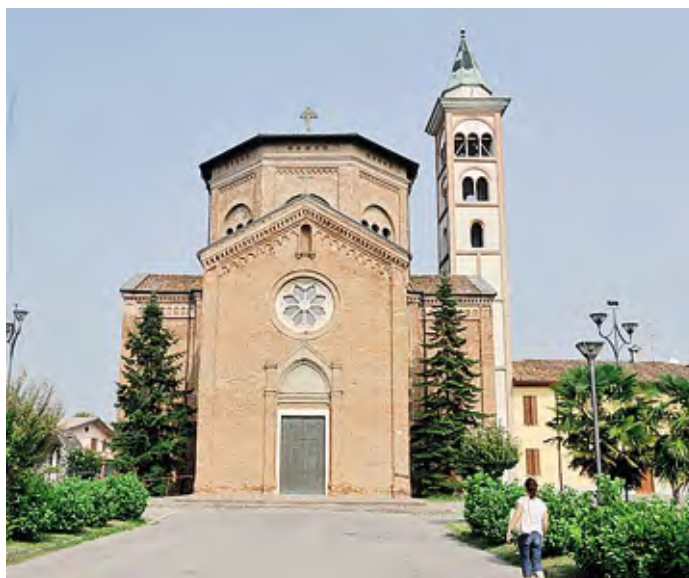
La chiesa parrocchiale di Nosadello: il primo maggio è atteso il vescovo

Così «la Chiesa, in tutta la sua vita, mantiene con la Madre di Dio un legame che abbraccia, nel mistero salvifico, il passato, il presente e il futuro e la venera come madre spirituale dell'umanità e avvocata di grazia» ( Redemptoris Mater ). Il mese di maggio diventa quindi per i cristiani il momento di farsi nuovamente bambini per lasciarsi cullare in questo amore materno. Non è un peccato, d'altronde, lasciarsi anda-