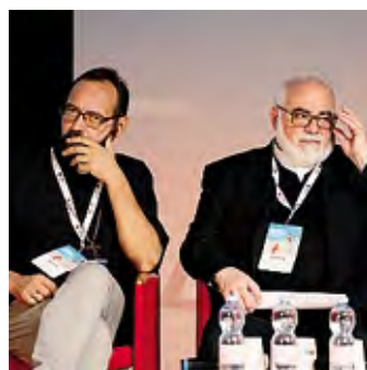
Sopra la delegazione di Caritas Lodigiana con Silvia Sinibaldi , a sinistra monsignor Christian Carlassarre e monsignor Joseph Bazouzou , a destra Romano Prodi alla tavola rotonda