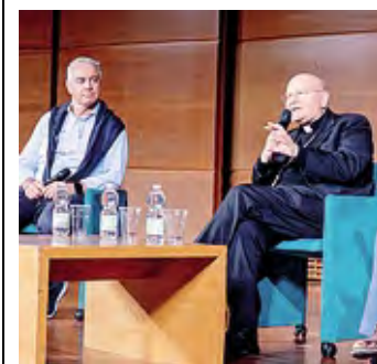
Zaggia e monsignor Sorrentino

Il prossimo venerdì, 1 maggio, per l'inizio del mese mariano, il vescovo Maurizio sarà a Nosadello, dove presiederà la santa Messa alle ore 20,30, pregando la sacra Famiglia per il mondo del lavoro. Seguirà la benedizione del rinnovato organo della chiesa parrocchiale: uno strumento costruito nel 1853 dall'organaro bergamasco Giuseppe Cavalli, che è stato riportato all'originario splendore dalla bottega Inzoli di Crema. ■