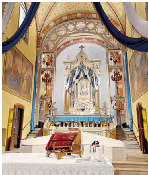
Il santuario della Mater Amabilis a Ossago Lodigiano

Tutto è pronto per la festa di oggi al santuario dedicato alla Mater Amabilis. In questo anno centenario dall'elevazione a santuario della chiesa di Ossago, nonostante le conseguenze dell'incendio del Venerdì Santo che ha reso momentaneamente inagibile l'edificio religioso, il fervore dei parrocchiani e il desiderio dei devoti non potevano andare delusi. La giornata inizierà alle ore 8 con la recita del Santo Rosario, a seguire la celebrazione della Messa in suffragio dei benefattori del santuario defunti e la benedizione della Fiaccolata della Speranza. Il momento centrale della giornata vedrà la presenza del vescovo Maurizio, che sarà accolto con gli ammalati e i fedeli sotto la tensostruttura in piazza per la celebrazione dell'Eucarestia. In precedenza, alle 15, arriverà la Fiaccolata della Speranza con l'offerta alla Mater Amabilis. Alle 15.30 la Santa Messa presieduta dal pastore della diocesi alla presenza degli ammalati e dei volontari Unitalsi. Nel tardo pomeriggio, all'17, la recita del Rosario e quindi la celebrazione della Messa alle 17.30. In serata, dalle 20.30, è prevista la recita dei Vespri, a seguire la processione fiaccolata presieduta da monsignor Cesare Pagazzi, che si snoderà per le vie del paese (piazza della Chiesa, via Aldo Moro,