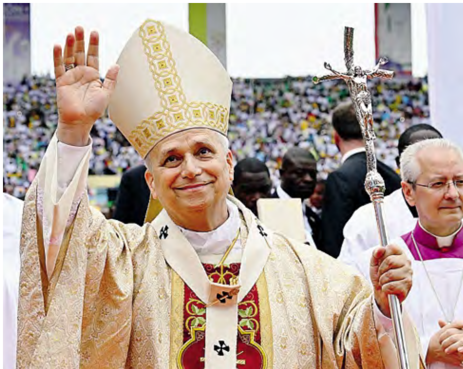
Il Papa in Guinea nei giorni scorsi; a destra, la preghiera del vescovo e i volti di Sant'Angelo

Entusiasmo per il Pontefice, che giungerà da Pavia sulle orme di Santa Francesca Cabrini. Prime riunioni operative. Ieri sera la preghiera del vescovo di Lodi ■ alle pagine 2, 3 e in Chiesa