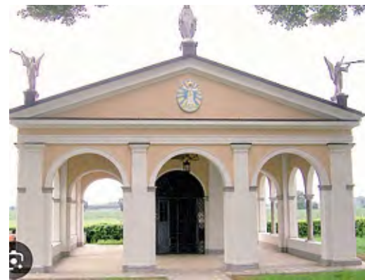
Il vescovo inaugurerà il 10 maggio il rinnovato sacello