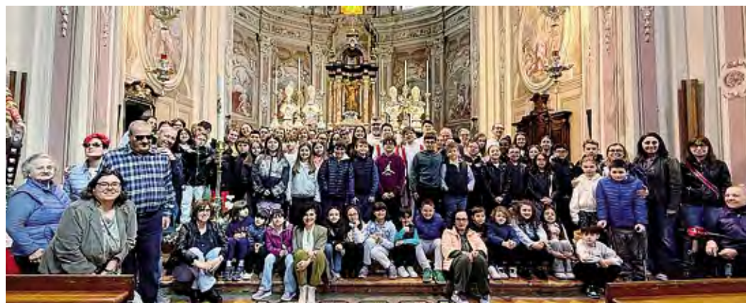
I partecipanti alla giornata di condivisione proposta all'oratorio di Caselle Lurani a sostegno delle attività del Mac

La giornata è poi diventata festa a tavola, con un pranzo che ha riunito ottanta persone arrivate da Brembio, Secugnago, Lodi e dalla