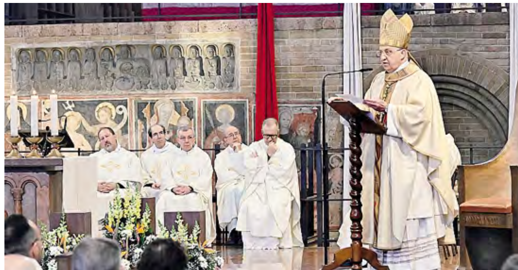
La Messa del Crisma in cattedrale presieduta dal vescovo Maurizio e concelebrata da tantissimi sacerdoti Borella