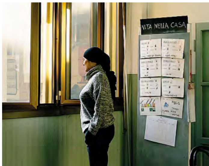
Casa Regina Pacis è la struttura di accoglienza femminile della Caritas