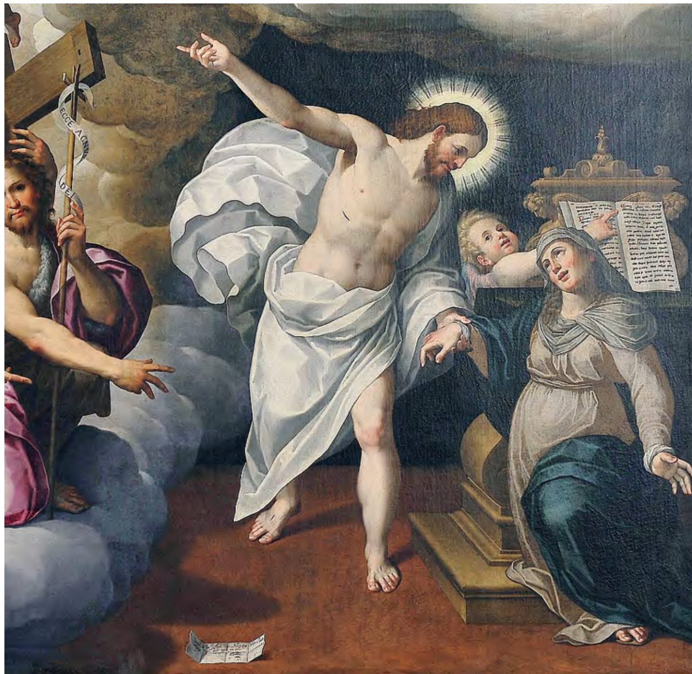
Giovan Battista Trotti, detto il Malosso, "Apparizione del Risorto a Maria", 1600 circa, seconda sede del Museo diocesano di arte sacra di Lodi

OSSAGO Il vescovo ieri sera alla Airpack; sciopero alla H&M di Casale