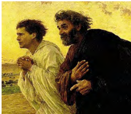
Pietro e Giovanni corrono al sepolcro Eugene Burnand

Pure il sepolcro ha qualcosa da dire. Dopo essere stato abitato dalla salma del condannato alla crocifissione e quindi dal silenzio di Dio, il sepolcro ha rigettato il Vivente che non poteva restare in un luogo di morte. Giuda, mercante pessimo, vende il Sole alle tenebre, risorge dal sepolcro la Luce intramontabile: così canta un inno ambrosiano. Quella tomba è rimasta con la bocca aperta per lo stupore e la sorpresa verso il suo ospite di onore e per testimoniare che la morte ora non potrà più divorare quelli che si affidano a Cristo. Da