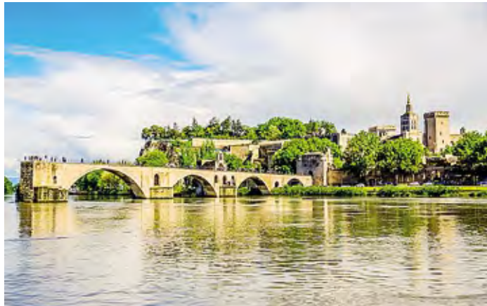
Nelle immagini due scorci della Provenza, meta del viaggio dei lodigiani

tori. Sarà poi la volta di Ganagobie, abbazia arroccata su un altipiano con vista panoramica sulla Durance, fondata tra il IX e il X secolo. È nota per essere un gioiello dell'arte romanica, con notevoli mosaici medioevali nell'abside e un portale con un timpano scolpito. Oggi ospita una comunità monastica dedicata alla preghiera e alla produzione di vari prodotti artigianali, tra cui miele e saponi. La quinta abbazia sarà l'Abbaye De MontMajour, straordinario complesso monastico medioevale situato su una collina alle porte di Arles. Fondata nel decimo secolo, l'abbazia conserva importanti testimonianze di architettura romanica e gotica, tra cui la chiesa abbaziale, la cripta e la torre di Pons de l'Orme. La visita di questi gioielli sarà occasione per scoprire sempre meglio il senso che il monachesimo ha avuto all'interno dell'epoca medioevale e soprattutto consentirà ai pellegrini lodigiani di comprendere il