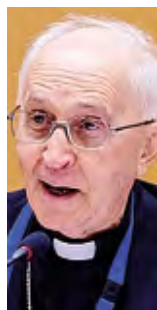
In alto una celebrazione dell'Oessg nella chiesa di Santa Maria della Pace a Milano presieduta dal vescovo di Lodi monsignor Maurizio Malvestiti, sopra il cardinale Fernando Filoni

Venezia Giulia ed Emilia Romagna. Anche Lodi vanta una delegazione che è completata da associati delle diocesi di Crema e Cremona. L'Oessg è l'unica istituzione laicale dello Stato Vaticano e entrare a farne parte significa assumere, per tutta la vita, l'impegno di testimonianza di fede, di pratica di vita cristiana esemplare e di impegno caritativo continuativo per il sostegno economico delle comunità cristiane di Terra Santa, da attuare con discrezione così come deve essere il vero impegno caritativo cristiano. L'Oessg ha lo scopo di rafforzare nei suoi membri la pratica della vita cristiana, in assoluta fedeltà al Pontefice e secondo gli insegnamenti della Chiesa, osservando come base i principi della carità dei quali l'Oessg è un mezzo fondamentale per gli aiuti alla Terra Santa. Ha il fine di sostenere ed aiutare le opere e le