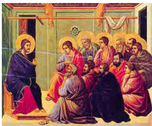
Maestà Dipinto di Duccio di Buoninsegna (1308-1311)

Il Vangelo parla di "comandamenti", di vincoli. Respiriamo una cultura che propone una visione della persona, quale unica misura e ragione di se stessa. Ma è sostenibile un amore senza vincoli? Un amore scriteriato (senza criteri), sfrenato (senza freni), non è vero, non è autentico. Non lo è nell'economia, quando si pensa solo a sé secondo un modello di sviluppo che non si preoccupi del bene di tutti; non lo è nell'ambiente, quando si privilegia lo sfruttamento delle risorse a vantaggio della voracità solo di alcuni; non lo è nei comportamenti quando nel confronto si manca di rispetto verso l'altro. Allora non ci disturba l'accostamento che Gesù fa tra amore e comandamento, perché l'amore non è mai senza responsabilità verso il bene personale e comune, e anche nei confronti di Dio. Dice infatti Gesù: « Se mi amate, osserverete i miei comandamenti... Chi accoglie i miei comandamenti e li osserva, questi è colui che mi ama ». L'esempio che Gesù stesso ci ha offerto non è di un amore riconducibile a puro sentimento, a stato emozionale, oppure un amore ridotto a buonismo, relativismo, incapace di proposta critica e responsa-