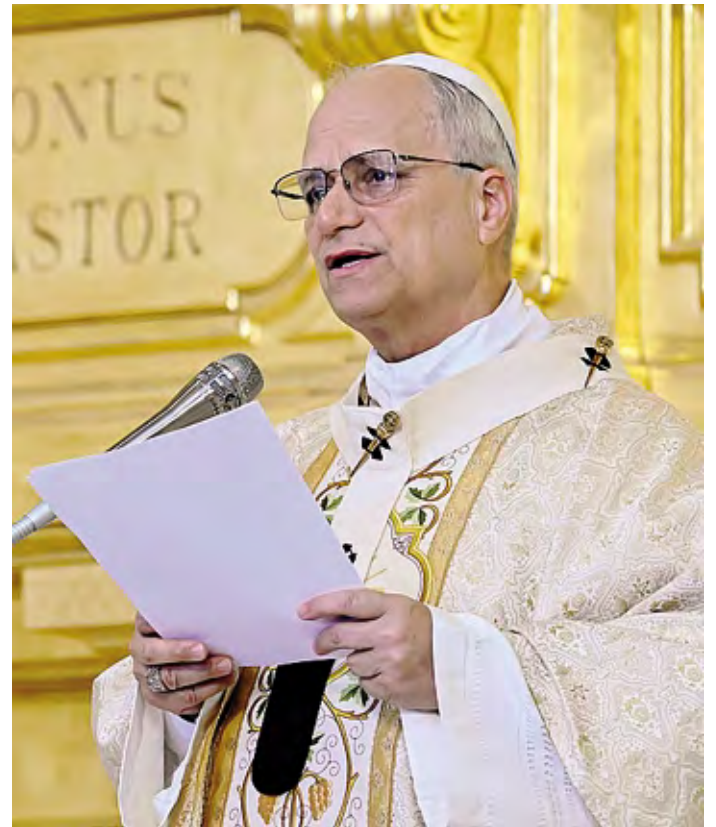
Campane a festa nelle chiese della diocesi di San Bassiano per Leone XIV