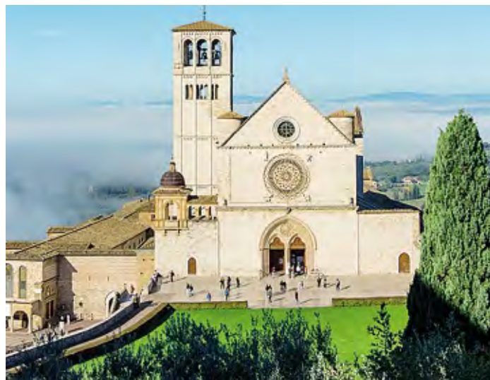
Pellegrinaggio: sopra la Basilica di Assisi, nel tondo san Francesco

imitare da vicino. Saranno dunque cinque giorni (25 - 29 agosto) alla riscoperta di san Francesco e della sua spiritualità che in quei luoghi ha preso forma, consegnando alla Chiesa e al mondo intero una lim-