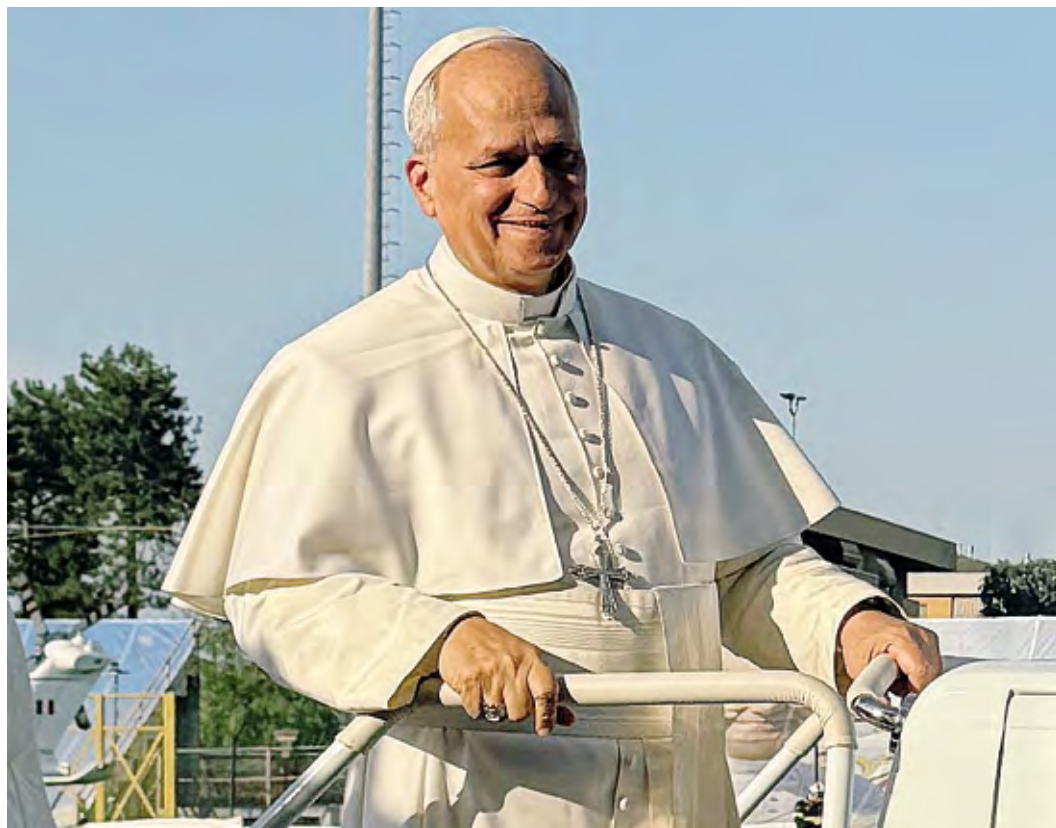
Sopra Papa Leone XIV allo stadio comunale "Chiesa" di Sant'Angelo in occasione della visita di sabato 20 giugno

La presenza del Papa tra noi, la scorsa settimana, è stata anche un incoraggiamento a tornare con spirito nuovo a vivere la missione cristiana, in ogni luogo, nei luoghi della vita quotidiana, in cui spesso è difficile essere testimoni. D'altronde, il Santo Padre l'ha ripetuto anche pochi giorni fa, a conclusione del discorso dedicato alla santa missionaria madre Cabrini: «Possa