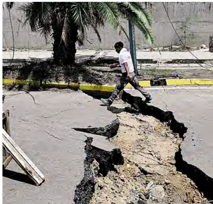
Un uomo su una strada lesionata dopo il terremoto in Venezuela

una risposta impersonale ma un gesto di autentica prossimità. Di fronte a questa nuova ferita, siamo chiamati a riscoprire la gioia del donare, un atto che accorcia le distanze geografiche e ci fa sentire parte di un'unica comunità umana. È possibile contribuire agli interventi tramite Caritas Italiana per l'emergenza attraverso donazione online, conto corrente postale n. 347013 o bonifico bancario, specificando nella causale "Emergenza in Venezuela". Per ulteriori informazioni https://caritaslodi.it/blog/2026/06/26/terremoto-in-venezuela-la-risposta-caritas-tram-emergenza-e-prossimita/ . ■