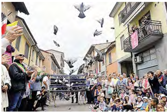
A lato Santa Cabrini, sopra il tradizionale volo delle colombe

Mercoledì 8 luglio alle 15, alla casa natale di madre Cabrini, la recita del Rosario, alle 21 la liturgia eucaristica celebrata da don Luca Roveda. È in calendario giovedì 9 luglio invece in mattinata, il pellegrinaggio a Codogno con visita e preghiera alla chiesa dedicata alla patrona degli emigranti, a seguire pranzo presso l'Istituto cabriniano. Venerdì 10 luglio ecco il "Cammino